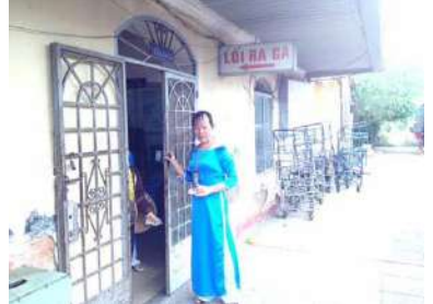
ビエンホア駅改札