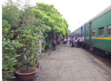
民家の庭がホームになっているように見えます・・・