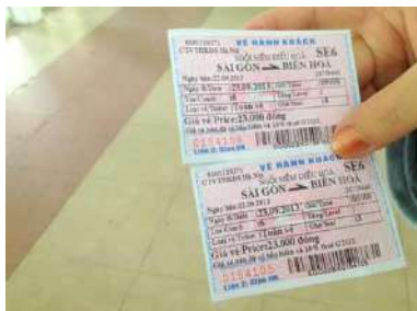
統一鉄道のチケット