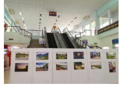
旧正月前には2階待合室もごつたがえします