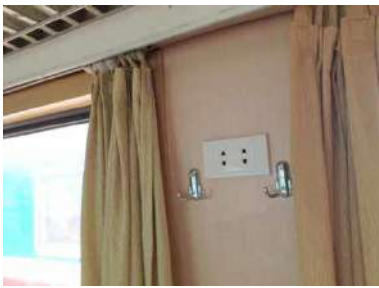
コンセントあり。日本のプラグ型がそのまま使えます