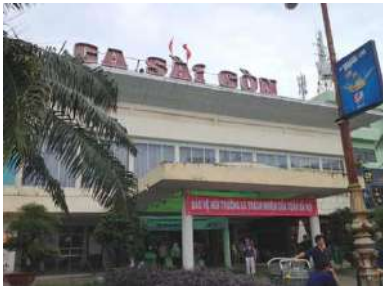
ベトナム最南端の「サイゴン駅」