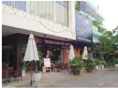
ベトナムのスターバックス「チュングエンコーヒー」