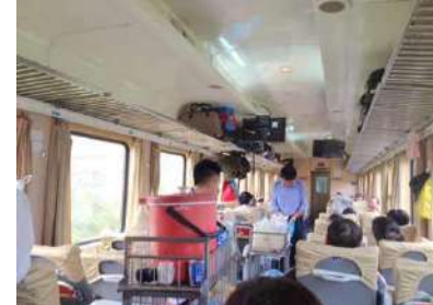
車内販売もあります