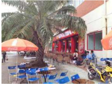
駅内にはロゼテリアが入っています