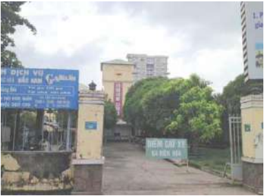
ビエンホア駅外観