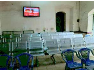
ビエンホア駅待合室