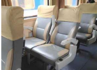
ソフトシートはリクライニング可能、回転はできません