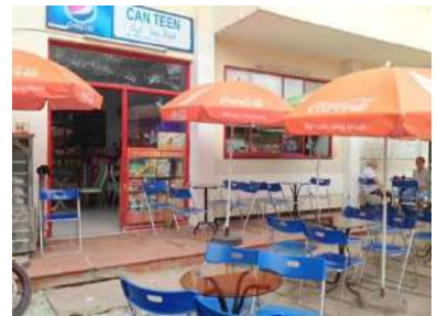
地元食堂もあります