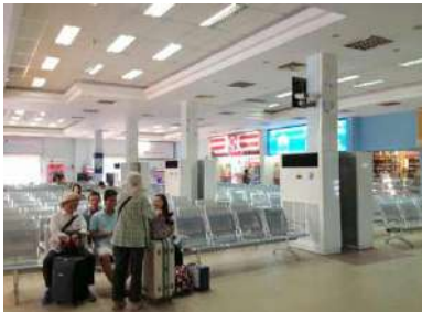
待合室にはサークルテーブルもあります