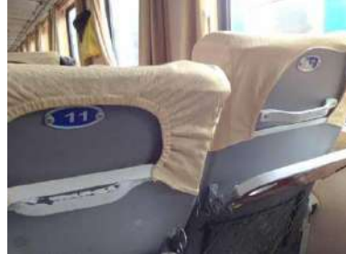
テーブル付。席番は椅子背もたれ側面で確認