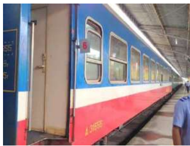
三段のステップを昇り客車へ