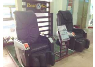
マッサージチェア、お試しは1回約1ドル