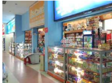
売店ではお菓子や飲み物の他に、新聞やお土産物もあります