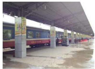
日本同様、首都へ向かう方が1号車