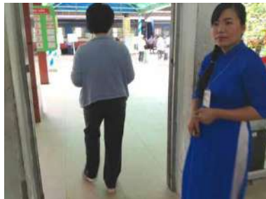
アオザイの駅員さんにチケットを見せて改札通過