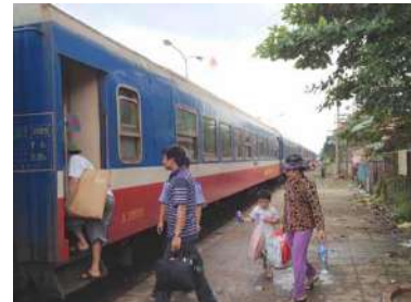
ビエンホア駅から列車利用する人