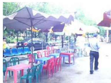
ビエンホア駅外青空カフェ