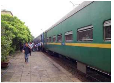
ビエンホア駅ホーム。ホーム脇はすぐに民家になります