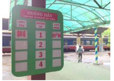
列車の発着案内板で、番線確認