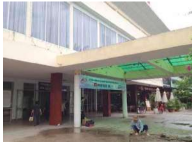
サイゴン駅構内入り口