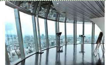
スカイデッキ日中