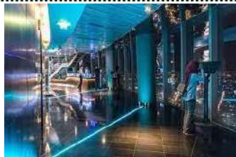
スカイデッキからの夜景もキレイ