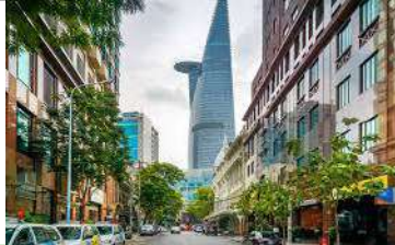
ドンコイ通りからも見えるビテクスコタワー