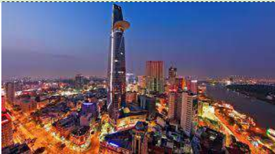
ビテクスコタワーと夜景