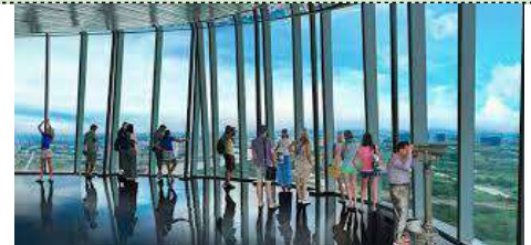
スカイデッキから見える景色