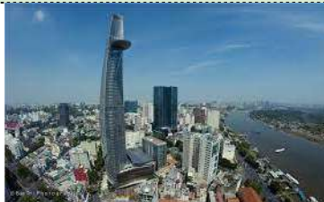
4区側からビテクスコタワーを望む