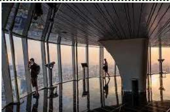
スカイデッキからの日没