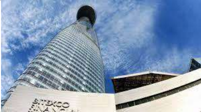
ビテクスコタワー目の前からの外観