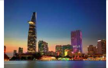
サイゴン川対岸 (2区) からの景色