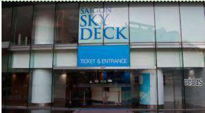
サイゴンスカイデッキの入口